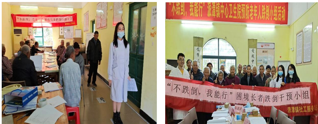
组员和医生、社工大合照

2、居家安全环境方面，为有需要的困难长者提供资源支持，开展居家安全环境改善活动，让长者生活在更安全的环境。