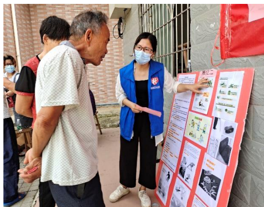
长者认真阅看跌倒知识，并与社工积极交流