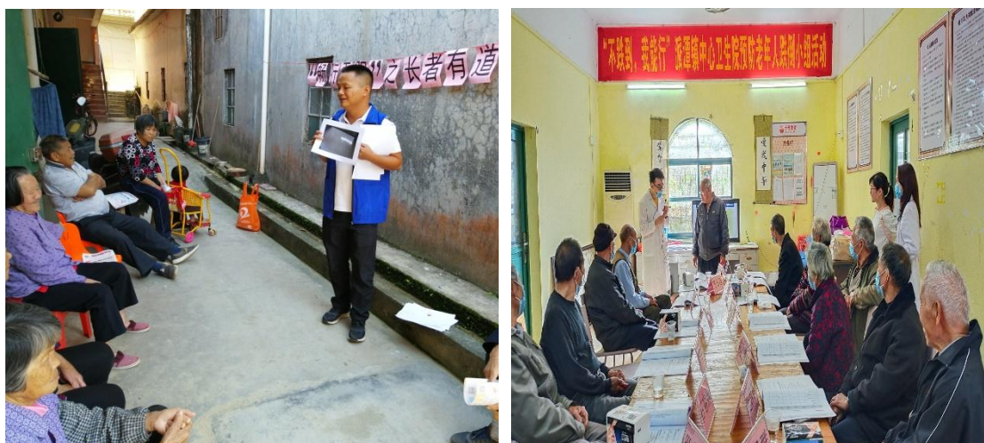
长者认真听医生讲防跌健康教育知识

(2)开展困境长者居家安全互助小组。社工开展了“不跌倒，我能行”困境长者跌倒干预小组，促进困境长者的社会参与和交流，增强困境长者预防跌倒的意识，降低长者跌倒的风险。