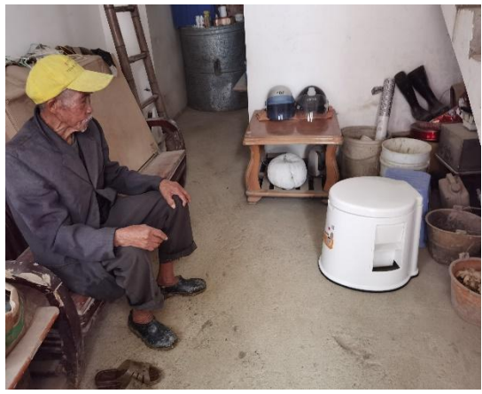
为长者配置轮椅、助行器、座便器等助残康复辅具 (2) 为 17 名长者配置生活防跌倒护具