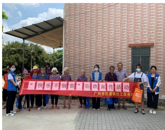
志愿者进行居家环境安全排查及活动合照